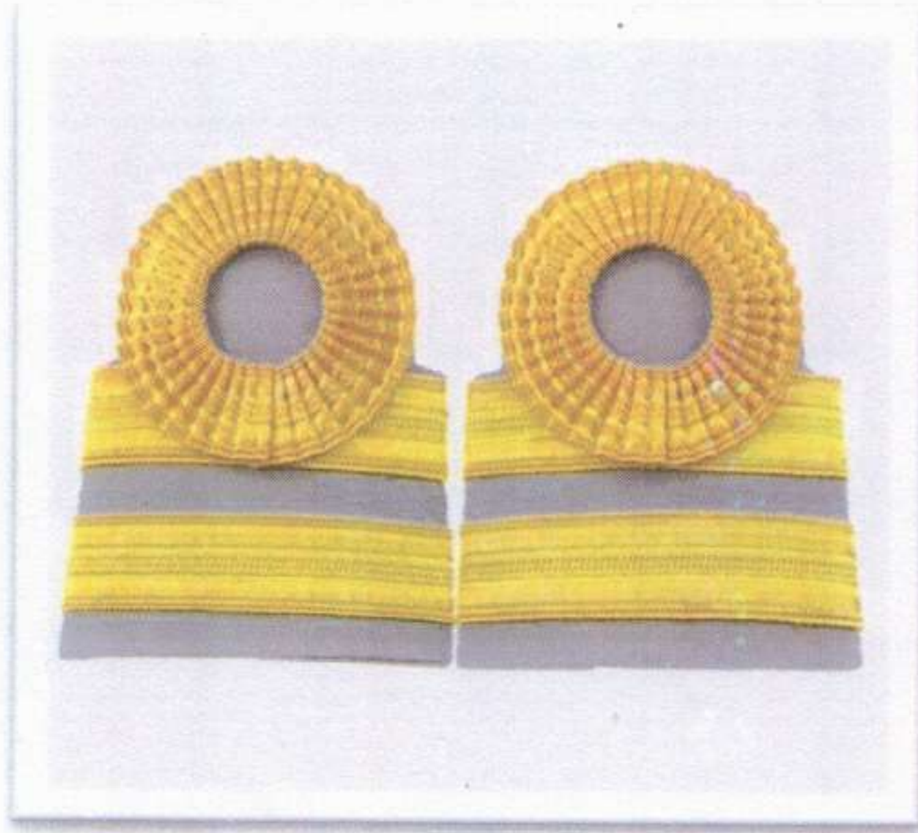
พนักงานราชการทั่วไป