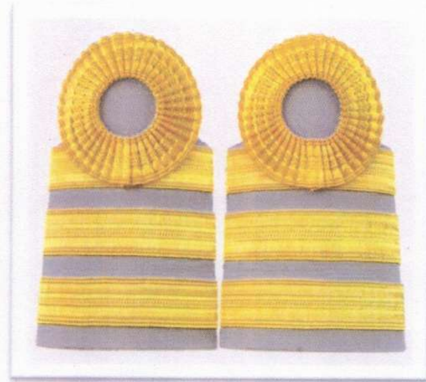
พนักงานราชการพิเศษ

อินทรรณู ให้ใช้อินทรรณูอ่อน มีเครื่องหมายบนอินทรรณู ดังนี้ ๑. พนักงานราชการทั่วไป มีแถบกว้าง ๑ เซนติเมตร ๒ แถบ (วงกลมทับแถบ) ๒. พนักงานราชการพิเศษ มีแถบกว้าง ๑ เซนติเมตร ๓ แถบ (วงกลมทับแถบ) แถบบ้างกล่าวให้ใช้สีเหลืองหรือสีทอง การติดแถบบให้ติดตามขวางที่ต้นอินทรรณู แถบแรกห่างจากต้นอินทรรณู ๕ มิลลิเมตร และแถบท่อไปเว้นระยะห่างกัน ๕ มิลลิเมตร