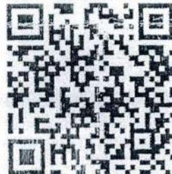
QR Code รายละเอียดการประภทวงดนตรี