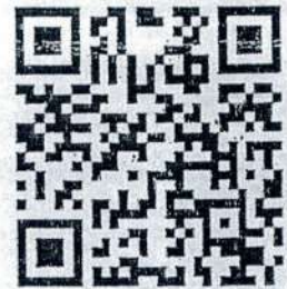
QR Code แบบตอบรับเข้าร่วมกิจกรรม