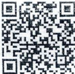
QR Code รายละเอียดการประภท TIKTOK