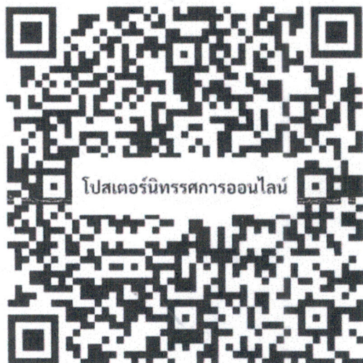
สแกนเพื่อดูงานโหลดโปสเตอร์