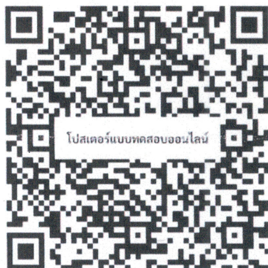
สแกนเพื่อดูงานโหลดโปสเตอร์