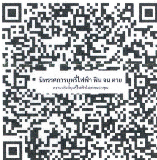
สแกนเพื่อเข้าชมนิทรรศการออนไลน์