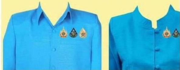
สุภาพบุรุษ บริเวณเหนือขอบกระเป๋าด้านซ้าย

ด้านนอก เข็มที่ระลึกตราสัญลักษณ์พระราชพิธีมหามงคลเฉลิมพระชนมพรรษา ๙๐ ๑๒ สิงหาคม ๒๕๖๕ ตรงกลาง เข็มที่ระลึกตราสัญลักษณ์พระราชพิธีบรมราชาภิเษก พุทธศักราช ๒๕๖๒ ด้านใน : เข็มที่ระลึกงานเฉลิมพระเกียรติพระบาทสมเด็จพระเจ้าอยู่หัว เนื่องในโอกาสพระราชพิธีมหามงคลเฉลิมพระชนมพรรษา ๖ รอบ ๒๘ กรกฎาคม ๒๕๖๗