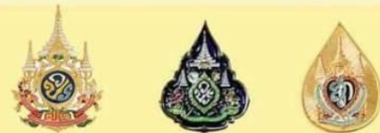
ด้านใน ตรงกลาง ด้านนอก

เนื่องในวันคล้ายวันเฉลิมพระชนมพรรษา สมเด็จพระนางเจ้าสิริกิติ์ พระบรมราชินีนาถ พระบรมราชชนนีพันปีหลวง ๑๒ สิงหาคม